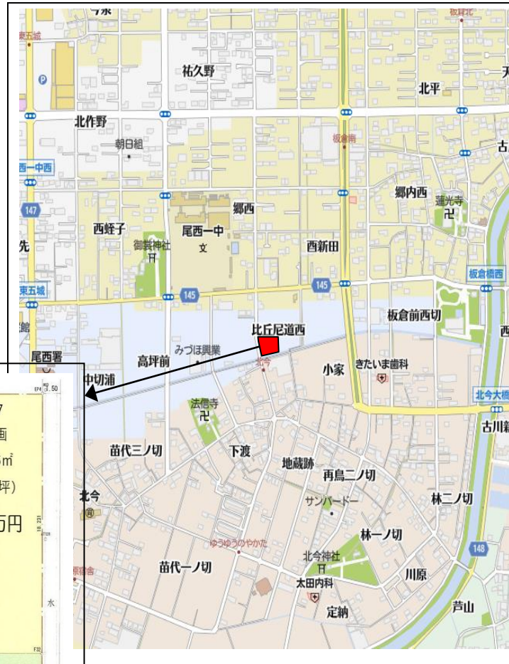
区画面積・価格表